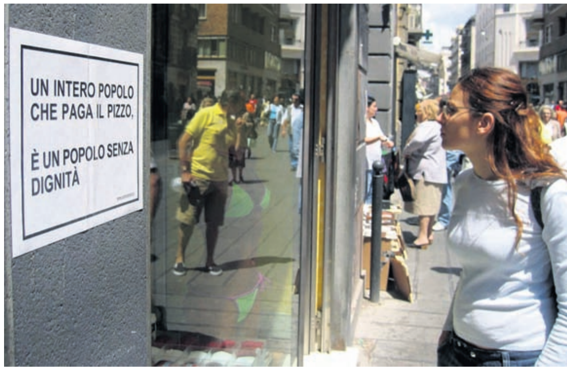
In this Wednesday, May 18, 2005 file photo, a poster against Camorra (Neapolitan Mafia), reading "People paying protection money are people without dignity", is seen on a wall beside a shop window in downtown Naples, Italy.

sters influence local authorities who award such lucrative contracts, DIA's nearly 900-page, semi-annual report to Parliament on the state of the country's crime syndicates noted that more than 50 municipal governments in Italy — mostly in the south, mobsters' traditional power bases, but also as far north as the Alps — are currently being run by local prefects, after investigators determined that crime bosses had conditioned elected town officials.